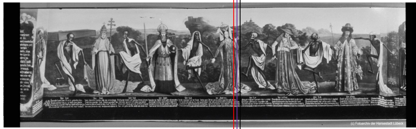
Ausschnitt aus dem einst 30 Meter langen und zwei Meter hohen Fries in Lübeck

Ein außergewöhnlicher Blickfang ist eine mehr als 20 Meter lange Reproduktion: