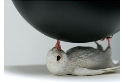
Atlas 2011 (C. Mause)

Kinder der Oberstufenklasse der Kardinal-von-Galen Schule Eslohe und Mitglieder der Gestaltungsklassen des Berufskollegs Bergkloster Bestwig sowie SchülerInnen der St. Walburga Realschule, Meschede stellen eine Auswahl ihrer Bilder aus